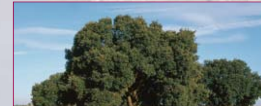
Reserva Natural de las Riberas de Castronuño.