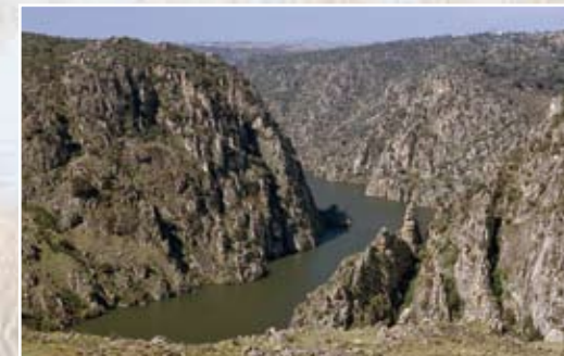
Arribes del Duero.

Lagunas esteparias: Ánsar común, aguilucho lagunero, grulla, archibebe común, fumarel cariblan-